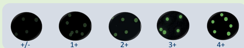
Product code: .....

Zou u het weten moest uw microscoop niet juist uitgelijnd zijn? Waarschijnlijk niet.