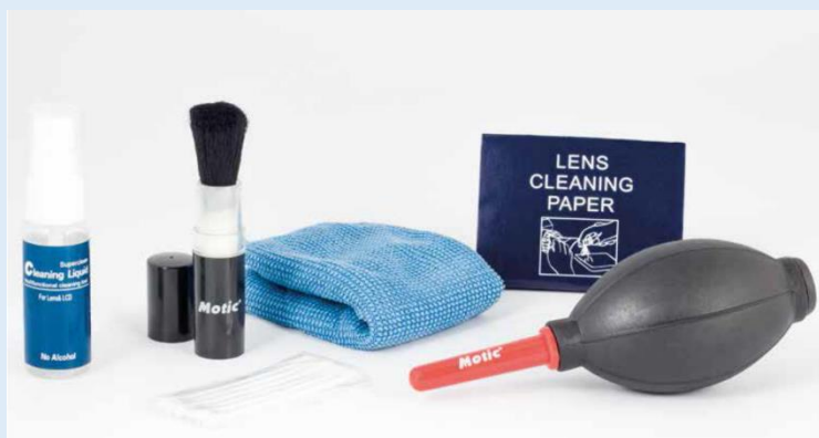
Product code: N61-MO-300111

Bestel nu 4 kits, en u ontvangt er 1 gratis bij !